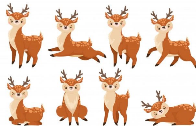
Eight n. 八