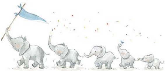
Five n. 五