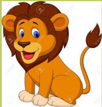
One n. 一