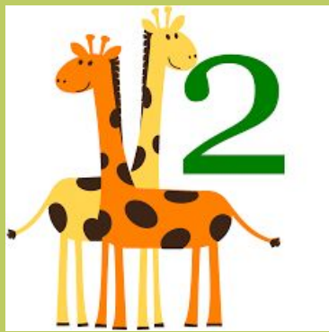
Two n. 二