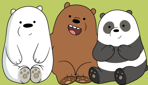
Three n. 三