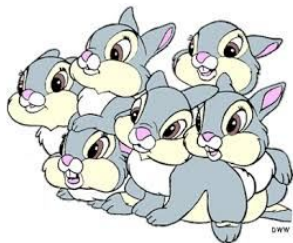
Six n. 六