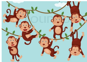
Seven n. 七