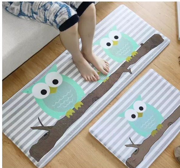
Two rugs 两张地毯