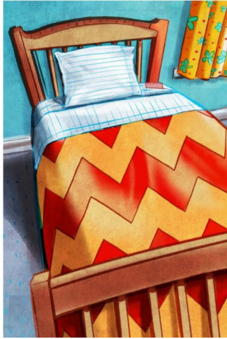
One bed 一张床