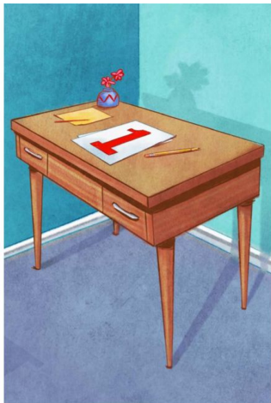
One desk 一个课桌