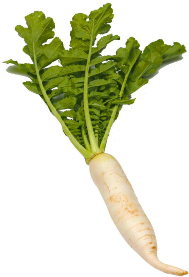
One radish 一个白萝卜