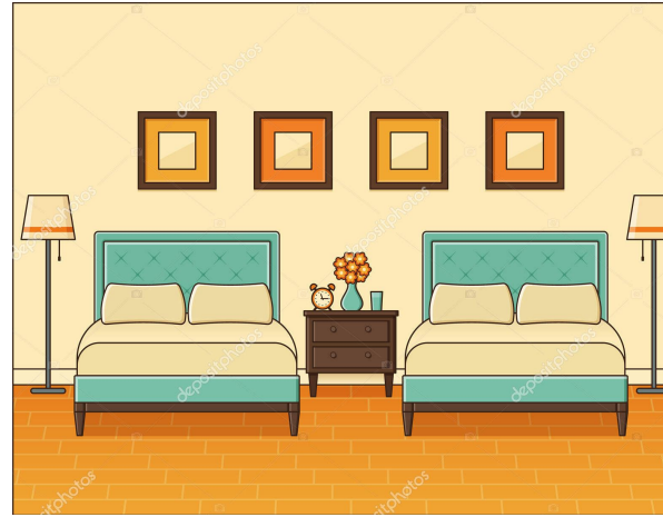
Two beds 两张床