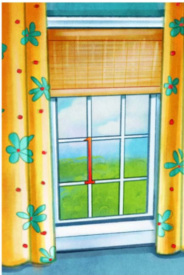
One window 一扇窗户