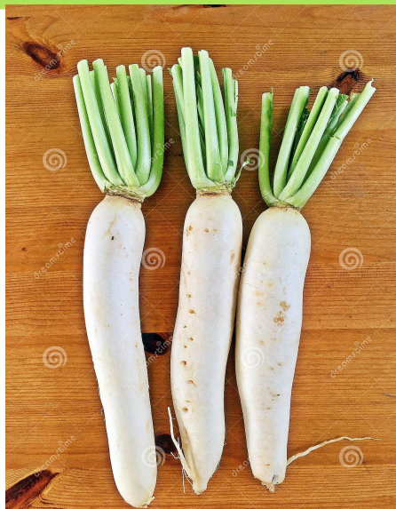
Three radishes 三个白萝卜