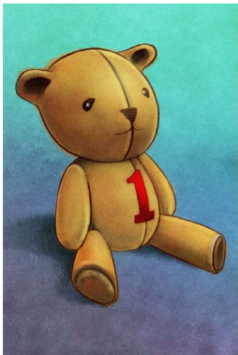
One toy 一个玩具