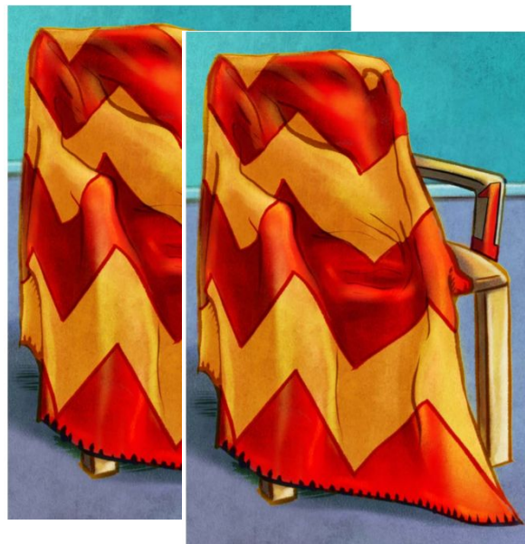
Two blankets 两张毛毯