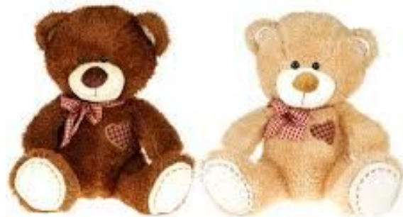
Two toys 两个玩具