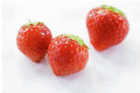
Three strawberries 三个草莓