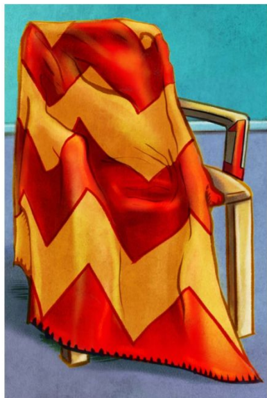
One blanket 一张毛毯