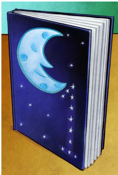
One book 一本书