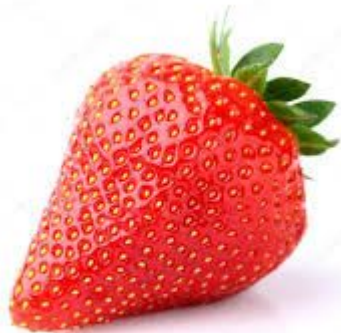
One strawberry 一个草莓