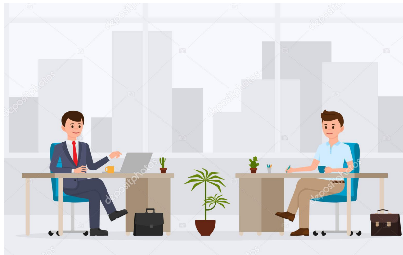
Two desks 两个课桌