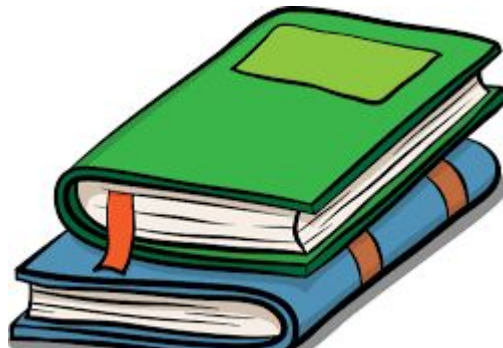
Two books 两本书